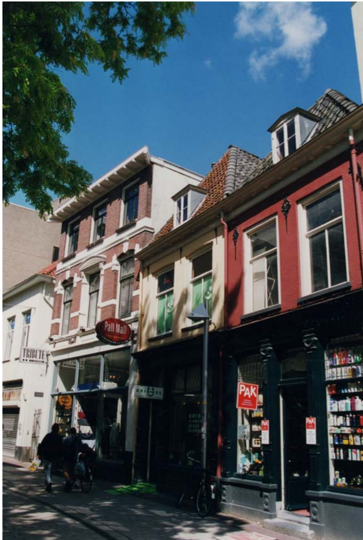
Afbeelding 26: Gevelwand in de Weverstraat.