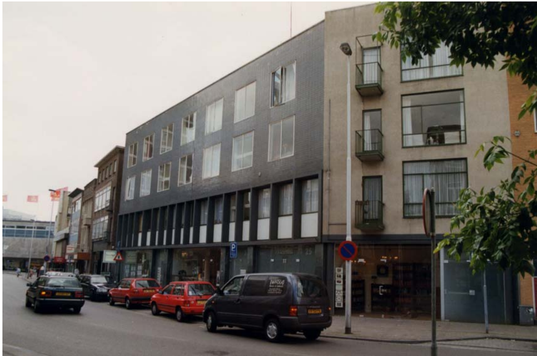
Afbeelding 39: Functionalistische architectuur in de Looierstraat.