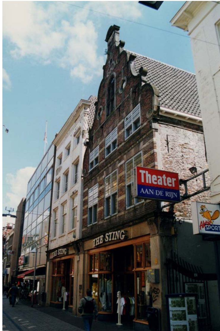
Afbeelding 24: Diepe huizen aan de Rijnstraat (nrs. 40, 41).