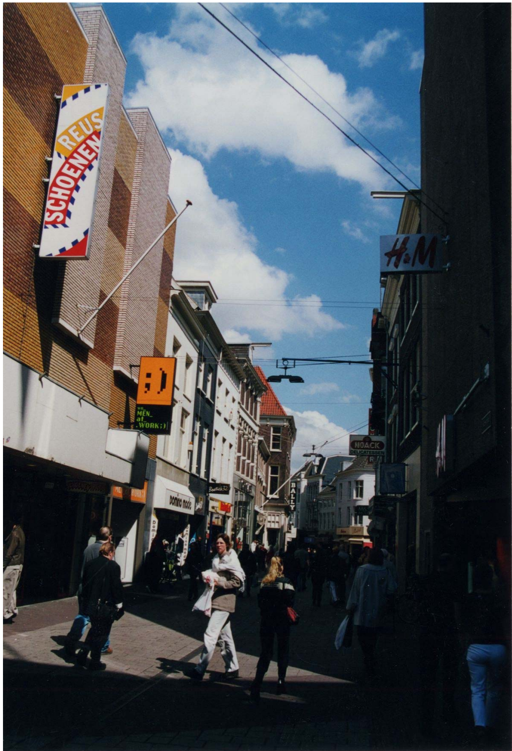
Afbeelding 2: De Vijzelstraat in oostelijke richting.