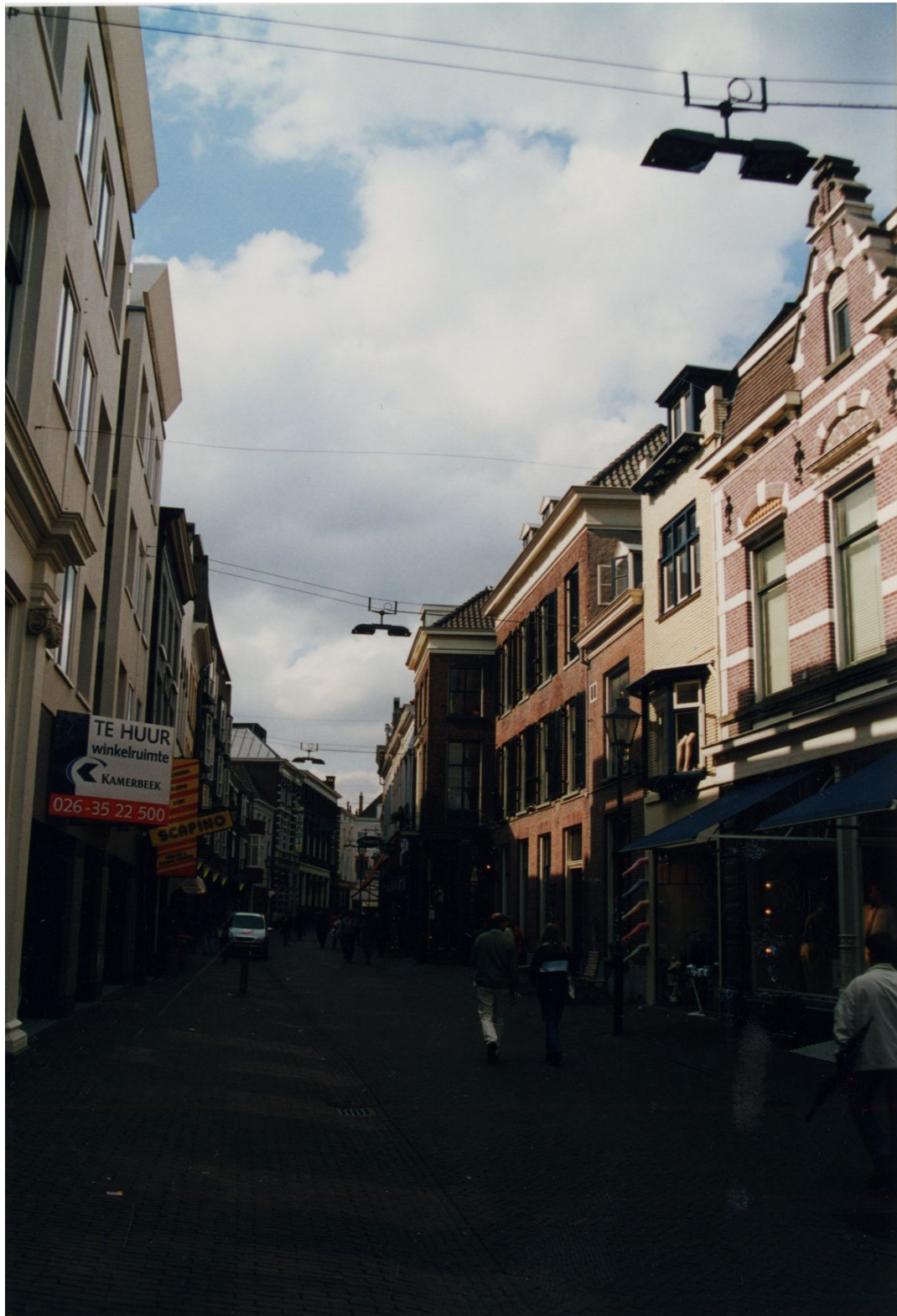
Afbeelding 6: Bakkerstraat, noordelijke deel.