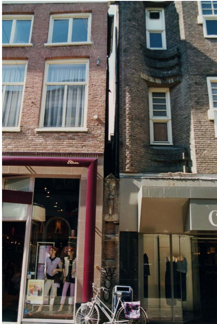
Afbeelding 18: Een osendrop in de Ketelstraat.