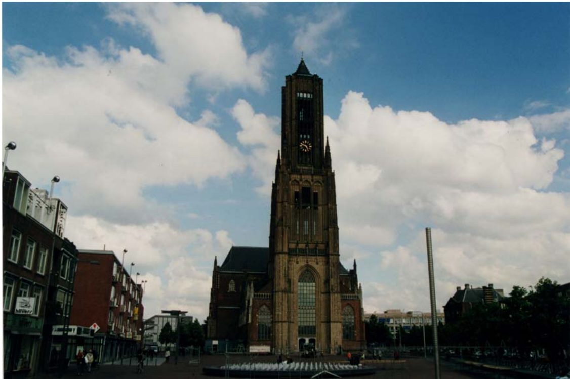
Afbeelding 12: Het Kerkplein met de St.Eusebiuskerk.