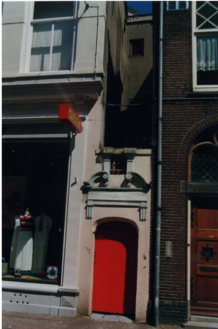
Afbeelding 16: Steegje met monumentaal poortje in de Weverstraat.