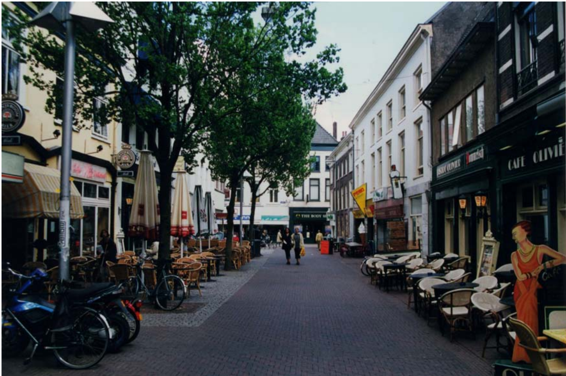
Afbeelding 8: Pauwstraat, in oostelijke richting. Op de achtergrond de Jansstraat.